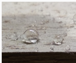
Hydrofobowość powierzchni dębowej

Po odpowiedniej obróbce powierzchni drewnianych powstaje niskoenergetyczna powierzchnia, która powoduje wyraźny efekt odpychania prawie wszystkich rodzajów cieczy. Ta silnie hydrofobowa i oleofobowa obróbka znacznie zmniejsza wchłanianie brudu. Dzięki temu zmniejsza się podatność powierzchni drewnianych na działanie mikroorganizmów (np. pleśni).